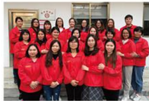
居家部 管理人员合影

中心团队呈现专业化、年轻化的特点：团队本科以上学历约占50%，大专以上学历占80%；其中社工督导及专业社工近180名，心理学、医学、管理学、财务等方面的专业人才约40名；除顾问外平均年龄约28岁，其中30岁以下（含30岁）约占80%。为保障服务质量，全体养老护理员亦执行了规范的岗前培训制度，全部持证上岗。