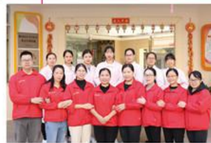
院舍部 管理人员合影