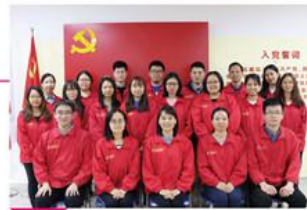
社工部管理人员合影

中心团队呈现专业化、年轻化的特点：团队本科以上学历约占50%，大专以上学历占80%；其中社工督导及专业社工近180名，心理学、医学、管理学、财务等方面的专业人才约40名；除顾问外平均年龄约28岁，其中30岁以下（含30岁）约占80%。为保障服务质量，全体养老护理员亦执行了规范的岗前培训制度，全部持证上岗。